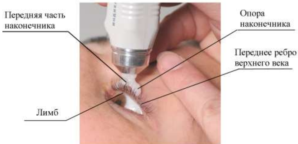
Рисунок 6 – Установка наконечника индикатора на веко