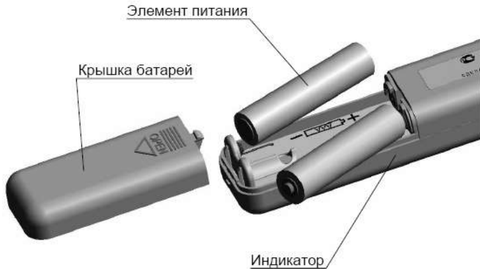
Рисунок 2 – Установка элементов питания