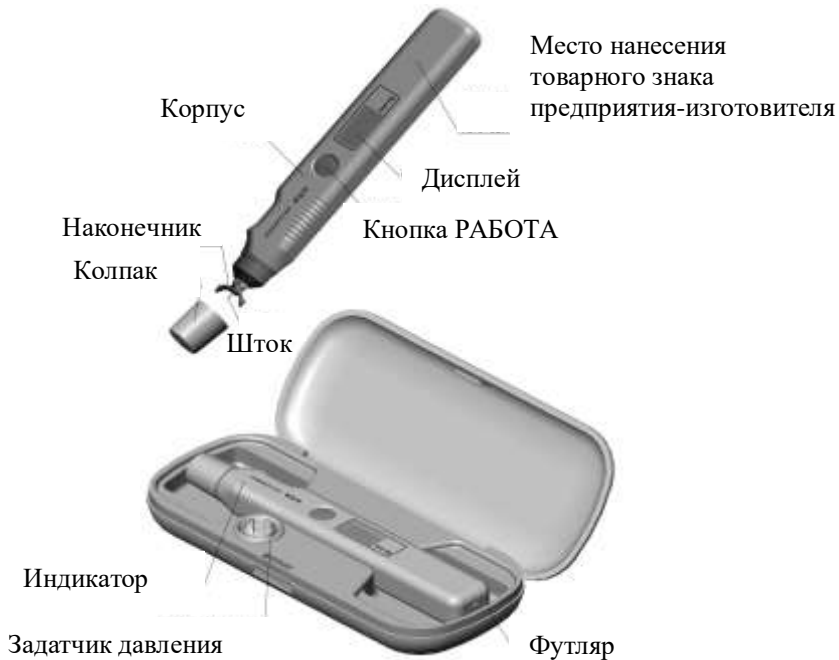
Рисунок 1 – Внешний вид индикатора ИГД-03