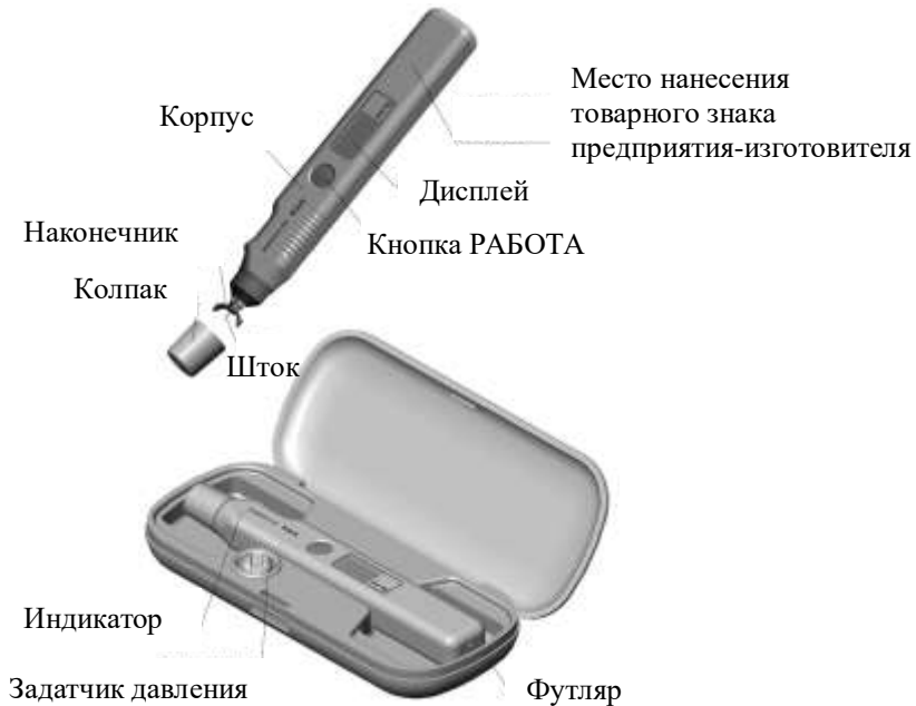
Рисунок 1 – Внешний вид индикатора ИГД-03