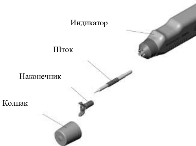
Рисунок 2 – Подготовка индикатора к очистке штокового механизма

ЗАПРЕЩАЕТСЯ одновременно проводить очистку штокового механизма двух и более индикаторов!